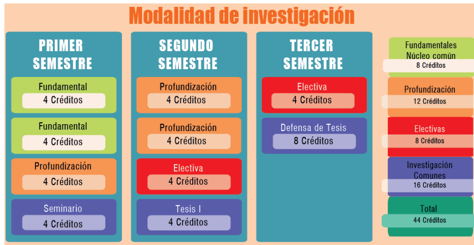
Ilustración 2. Estructura Curricular. Modalidad de Investigación todos los énfasis.

El plan de estudios en la modalidad de investigación está compuesto por 2 espacios académicos fundamentales (8 créditos), tres espacios de profundización (12 créditos), dos espacios electivos (8 créditos) y el núcleo de investigación (16 créditos) compuesto por el Seminario de investigación, Tesis I y Defensa de tesis.