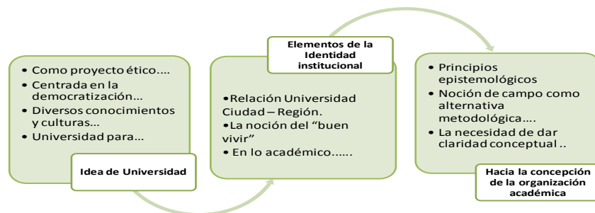
Figura 3. Hacia la Concepción de la Organización Académica