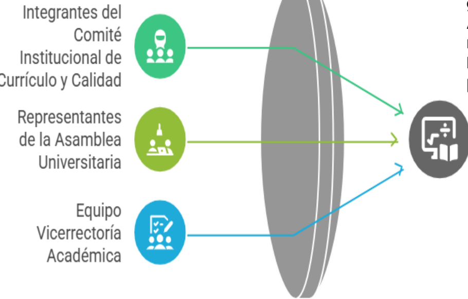
Art. 1 Resolución 033-2025 C.A